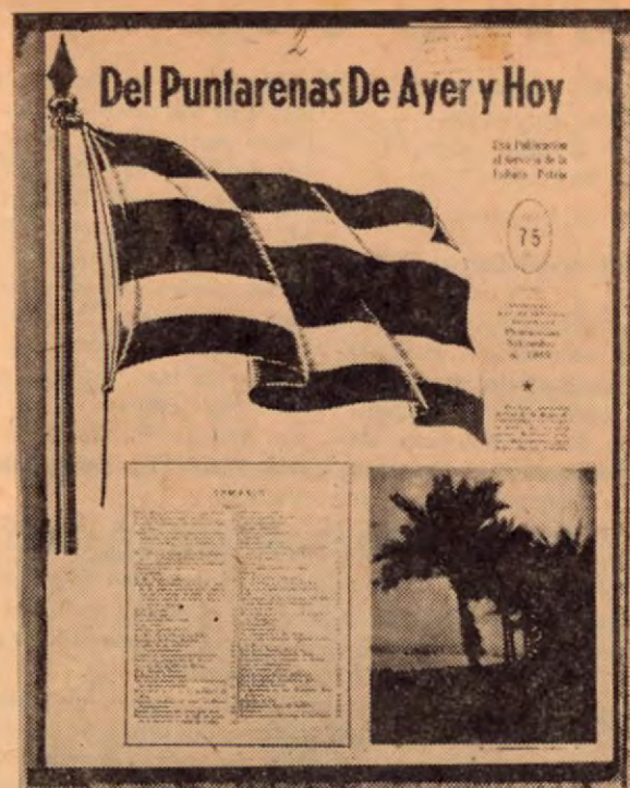
Segundo número de nuestra revista, cuando se llamaba "Del Puntarenas de Ayer y Hoy". (Set. 1946).