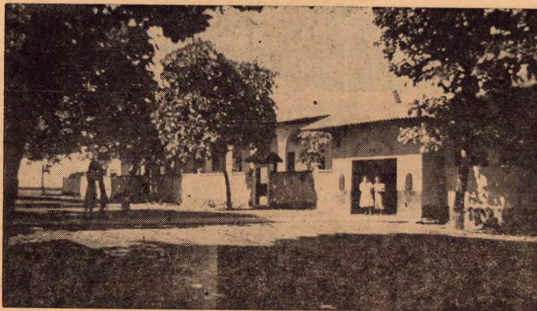
Bella Panorámica de la entrada del Hospital "San Rafael" de Puntarenas.

Nada de raro tiene esto, si recordamos que la punta de arenas ofrecía hacia el Norte, en el estero facilidades para que los botes y embarcaciones más grandes pudieran arrimar sin ningún peligro al hacer el embarque y desembarque de mercadería. Las referencias conocidas indican que el primero que se sirvió del puerto, lo hizo por utilidad personal, ya que su hacienda estaba en las inmediaciones, pero dicha circunstancia movió a los demás a imitarlo, hecho que varía completa-